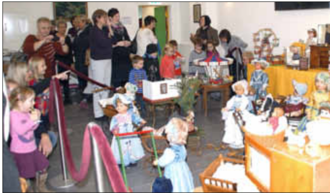
Viele Kinder und Erwachsene besuchten die Puppenausstellung

Nachdem im vergangenen Jahr eine Ausstellung mit fast 200 Spieluhren von Werner Luckardt eine große Resonanz gefunden hatte, war für Vereinsführung klar, auch in diesem Jahr wieder eine solche Veranstaltung durchzuführen und etwas Besonderes, das in die Adventszeit passt, zu bieten. So kam man auf die Idee, Puppen auszustellen.