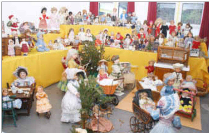
Blick auf die Ausstellung