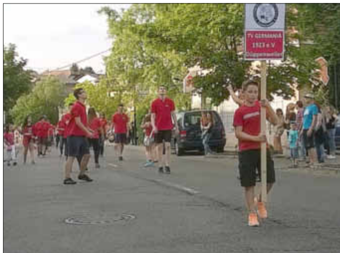
Zeltlager- und Volleyballjugend beim Eröffnungszug des Dorffestes 2014

Unser Zeltlager konnte wieder erfolgreich durchgeführt werden. Wir haben am Jubiläumsdorffest und mit respektablem Erfolg teilgenommen und recht kurzfristig für die St.Martinsfeier den Glühweinstand angeboten. mit dem 2. Familienabend an neuem Termin läuft nun so langsam das Jahr 2014 mit unseren Öffentlichen Veranstaltungen aus.